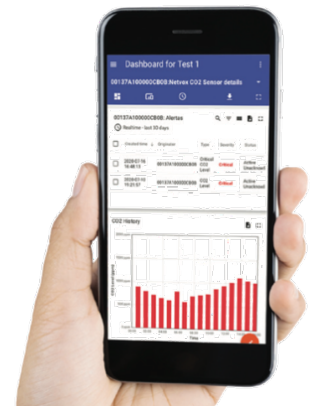
© Smart Box & GeoPortal - versión 2.0