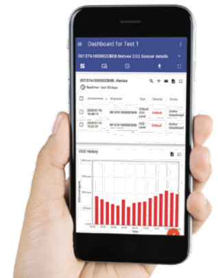
© Smart Box & GeoPortal - versión 2.0